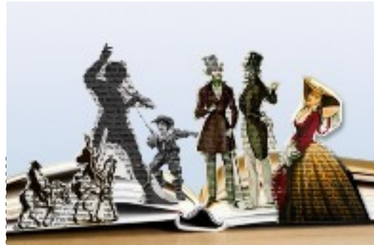
Apparition de héros 1100

Le double de l'auteur. Le romancier moderne interroge souvent sa propre vie, avec le roman autobiographique, le personnage principal, met son histoire à la première personne. 1924