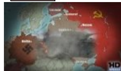
2nde guerre mondiale 1939--->1945

Bloody Sunday: (dimanche sanglant) est une tuerie survenue le dimanche 30 janvier 1972 dans le Bogside à Derry en Irlande du Nord, dans laquelle vingt-sept manifestants et passants pacifistes des droits civils ont été pris pour cible par des soldats de l'armée britannique. 13 hommes, dont sept adolescents, sont morts immédiatement et un autre homme est décédé quatre mois et demi plus tard, à la suite des blessures reçues ce jour-là. Quatorze personnes furent également blessées, douze par balles et deux écrasées par des véhicules militaires1. Cinq de ces blessés ont été touchés dans le dos2. Le drame est survenu au cours de la marche de l'Association nord-irlandaise pour les droits civiques. 1972