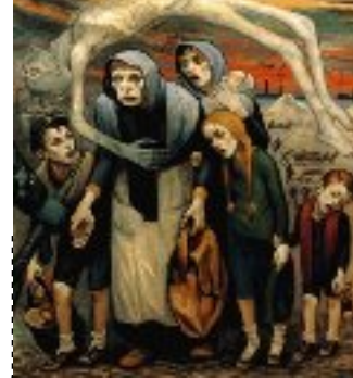
Les inaptes au travail, David Olère 1952