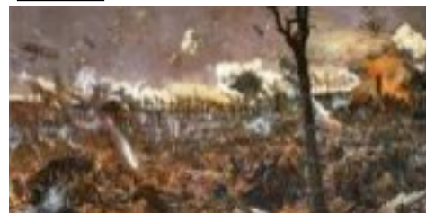
1ère guerre mondiale 1914 --->1918

Le soulèvement du Dos de Mayo (soulèvement du 2 mai) de 1808 est le nom sous lequel on désigne la rébellion du peuple madrilène contre l'occupation de la ville par les Français. 1808