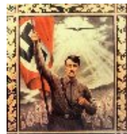
Vive l'Allemagne! 1930