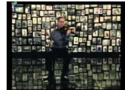
different trains, Steve Reich 1988