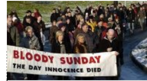
Bloody Sunday, Paul Greengrass 1972