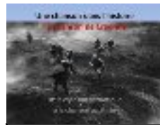
La chanson de Craonne Paul Vaillant Couturier 1917