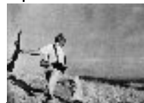
Mort d'un milicien devant Cordoue 1936