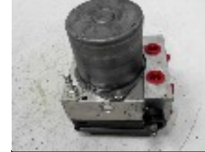
Invention du Système de blocage "ABS" 1970