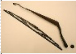
Invention du balais d'essuie-glace sur l'Automobile 1903