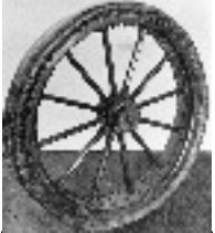
Invention du pneu Dunlop 1887