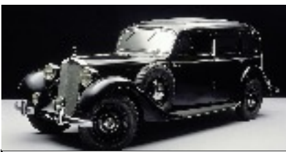
Mercedes 260D le diesel en série 1936