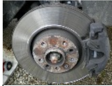
Invention du frein à disque sur l'Automobile 1851