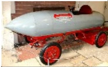
Commercialisation des premières électriques 1852