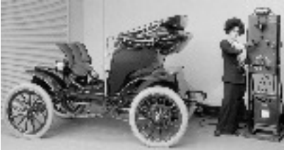
Apparition de la voiture électrique nouvelle génération 1830