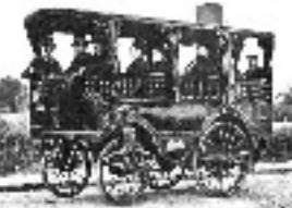
Apparition de "L'Obéissante" avec moteur à vapeur- 40km/h 1873