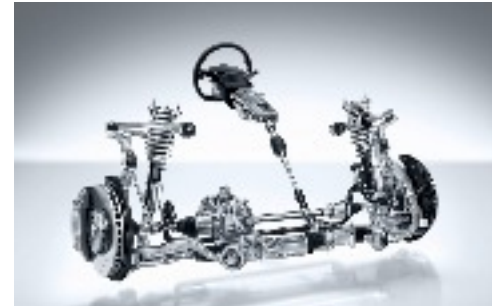
Invention de la direction assistée 1951