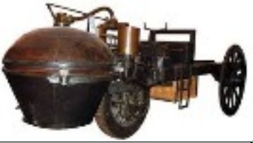
Invention de la première Automobile: "Le Fardier à vapeur" 1769