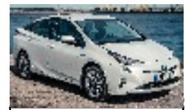
Apparition de la "Toyota Prius" 2015