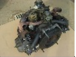
Invention du moteur à combustion interne 2 temps "Gaz à air dilaté" 1878