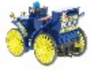
Invention du pneu Michelin 1895