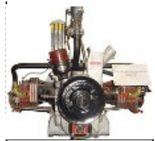
Invention du moteur à explosion 4 temps 1860