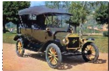
Apparition de la "Ford T" 1913