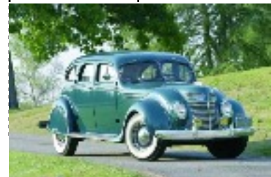
Apparition de la "Chrysler Airflow" 1934