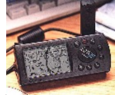
Invention du GPS sur l'Automobile 1995