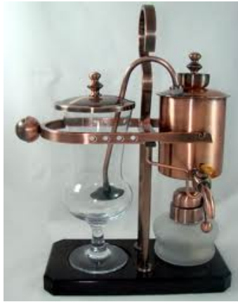
Cafetière en dépression avec le siphon balancier

Invention du système de percolation en 1800 par Jean Baptiste de Belloy