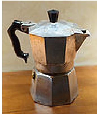
Cafetière en moka ou à l'italienne

Amélioration de la cafetière en dépression en 1844 par Louis Gabet qui invente le siphon balancier