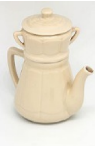
cafetière en percolation

Invention du système de percolation en 1800 par Jean Baptiste de Belloy