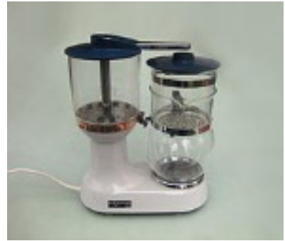
Cafetière électrique moderne

Invention de la cafetière à piston par l'italien Caliman en 1933