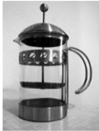
Cafetière à piston

Invention de la cafetière en moka ou à l'italienne en 1895 par Alfonso Bialetti