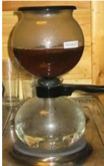
Cafetière en dépression de type cona

Invention de la cafetière en dépression en 1825