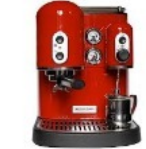
Machine espresso récente

Invention de la machine à espresso en 1884 par Angelo Moriodo ensuite perfectionnée par Luigi Bezzera en 1901 et encore améliorée en 1946 par Achille Gaggia