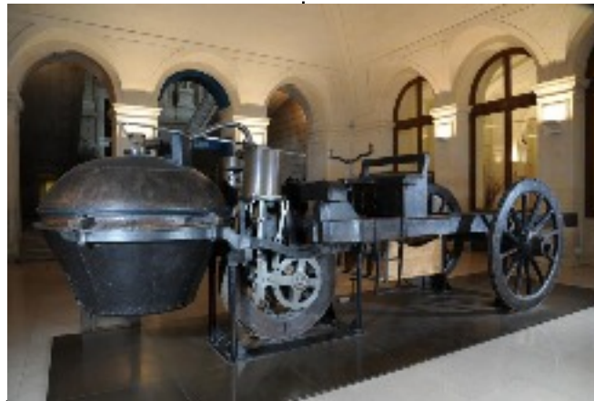
Fardier à vapeur Michel Brézin 1771