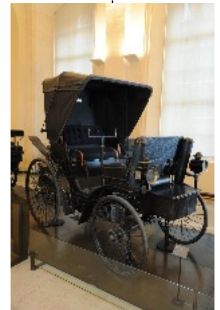
Quadricycle Peugeot Type 3 auteur intellectuel Daimier Motoren Gesellschaft auteur materiel Panhard-Levassor 1892