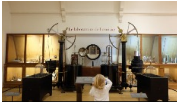
Gazomètre de Lavoisier 1787