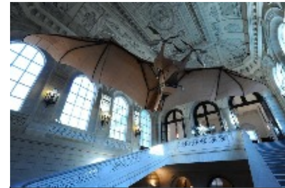
Aéroplane, dit Avion n° 3 Clément Ader 1897