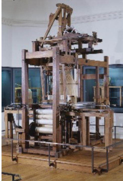
Métier à tisser Jacques de vaucanson 1746