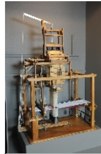
Métier à tisser Joseph Marie Jacquard 1866