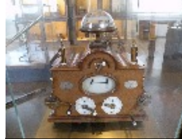
Télégraphe électrique Claude Chappe 1845