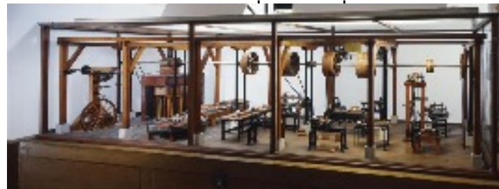
Atelier complet pour la fabrication des roues de voiture Eugène Marie Claude Philippe