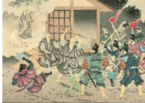
Persécution de Komatsubara ND est attaqué par soldats du régent Tojo Kagenobu 11/11/1264