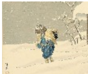
Exil sur île de Sado 01/11/1271