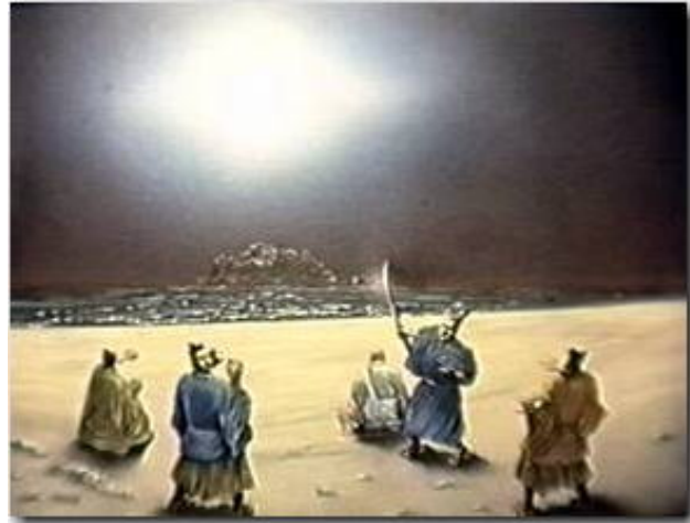
Persécution de Tatsunokuchi par Hei No Saemon ND révèle sa véritable identité de bouddha 12/09/1271