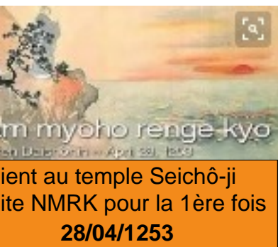
Niant au temple Seichô-ji ite NMRK pour la 1ère fois 28/04/1253