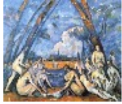
Russolo, 1913 Cézanne, 1906