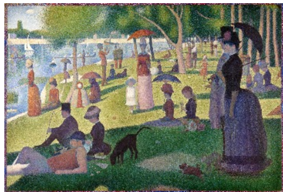
"Un dimanche à la Grande Jatte" (1884-1886) SEURAT 1884

LES NABIS: (prophetes en Hebreu). La ligne se déploie, a 2 tendances: 1° Paul SERUSIER (1863-1927) et Maurice D 2° Les modernes : Pierre BONNARD, Henri VUILLARD s