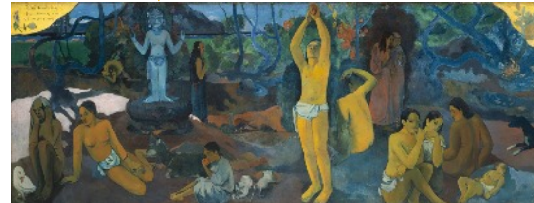
"D'où venons nous? Que sommes nous? Où allons nous?" GAUGUIN (1848-1903) "j'ai essayé dans un décor suggestif de traduire mon rêve ... avec toute la simplicité du métier" 1897