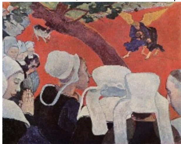
"La Vision après le Sermon" ou "La lutte de Jacob avec l'ange" Paul GAUGUIN (1848-1903). Toile qui marque une étape importante dans l'évolution d'un style qui communique un sentiment de mystère plus que la réalité. 1888