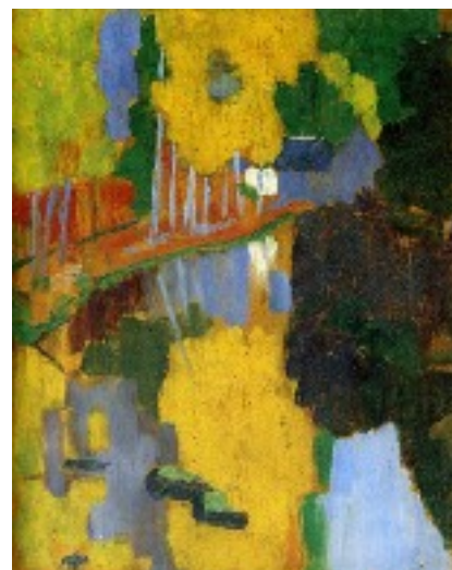
"Talisman" Paul SERUSIER (1863-1927), paysage presque abstrait, sur fond de boite a cigares 1888