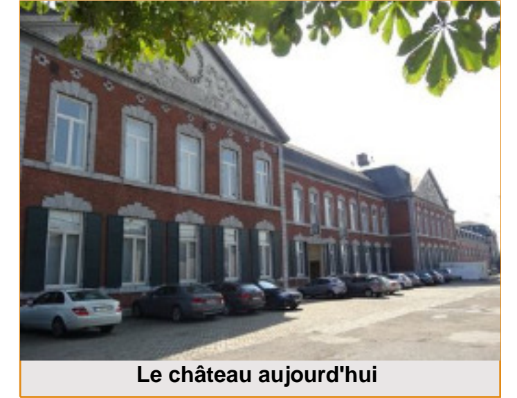
Le château aujourd'hui