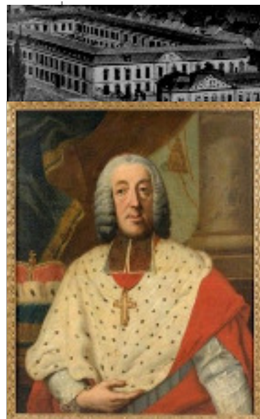
Jean-Théodore de Bavière (1744-1763) fait construire la cour du Manège, fermant la cour d'honneur au sud