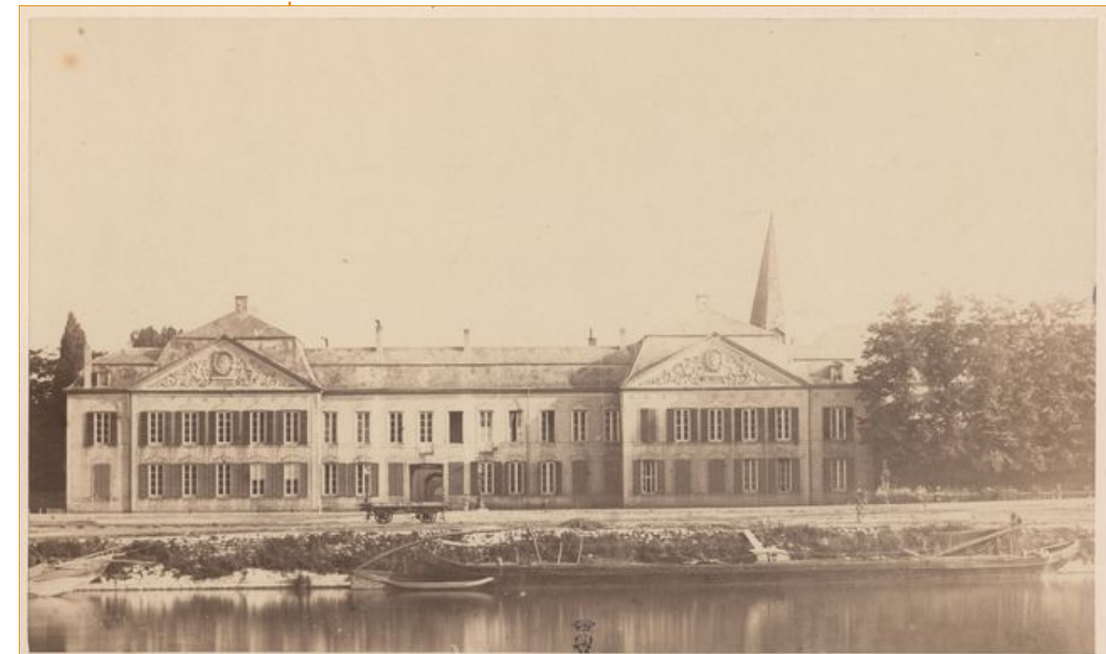
Photographie v. 1890 (?)