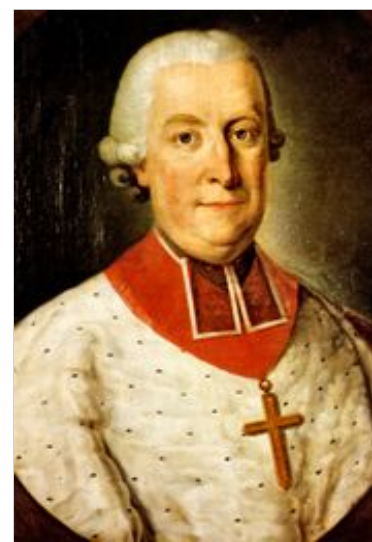
François-Charles de Velbruck (1772-1784) fait rénover l'angle nord-ouest et édifier le pavillon de droite --- autour de 1780