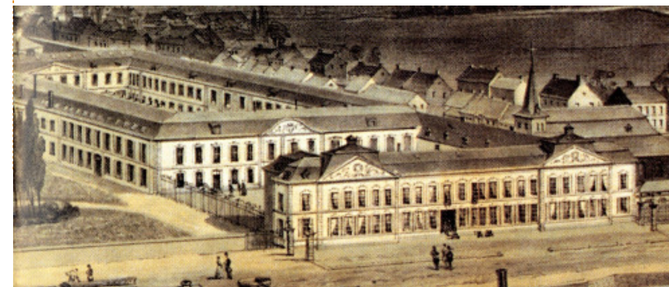
Lithographie coloriée par A. Canelle, extraite de «La Belgique illustrée» 1850