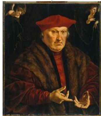
Érard de la Marck (1505-1538) fait reconstruire le château de Seraing --- v. 1505-1516