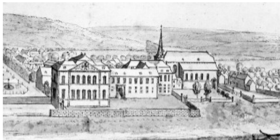
Dessin (extrait) de Remacle Le Loup pour « Les délices du Pays de Liège et de la comté de Namur », t. I 1738