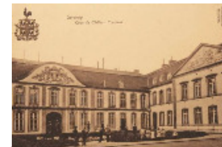
Un incendie ravage la cour du Manège. La façade nord est reconstruite «à l'identique». La fronton représentant «l'Enlèvement de Proserpine» est remplacé sur l'aile est de la cour d'honneur --- 1917