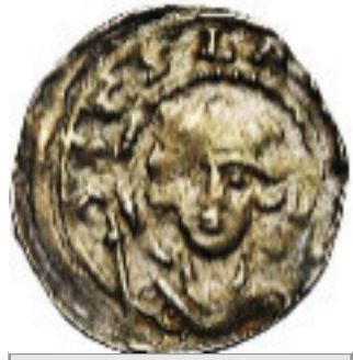
Le prince-évêque Henri de Verdun (1075-1091) réside à Seraing --- 1082