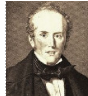
John Cockerill achète le château de Seraing et y installe ses usines --- 1817