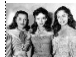
Les sœurs Brontë (1824, 1855) 1824