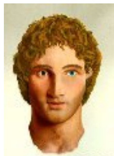
Alexandre le Grand (-356, -323) -338