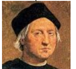
Christophe Colomb (1451, 1506) 1492