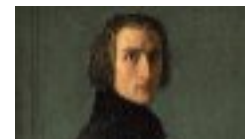
Franz Liszt, compositeur au grand cœur (1811, 1886) 1820