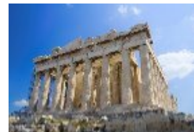
Le jour où la Grèce devint romaine -146