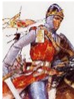
Baudouin IV, le roi lépreux (1161, 1185) 1174