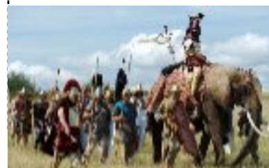
Deuxième guerre punique (-218, -202) -218