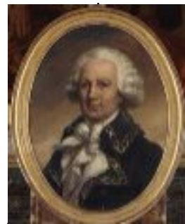
Louis-Antoine de Bougainville (1729, 1811) 1768