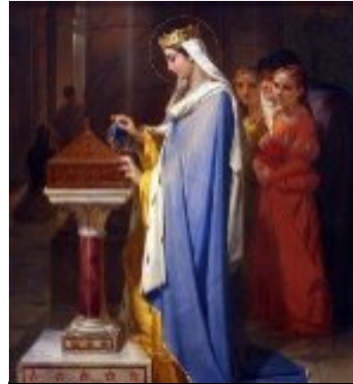
Elisabeth de Hongrie (1207, 1231) 1211