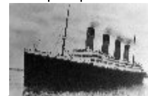
La catastrophe du Titanic 1912