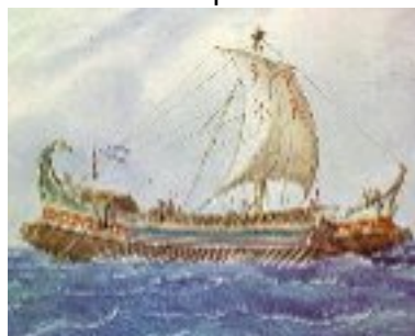
Première guerre punique (-264, -241) -264