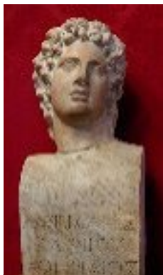
Alcibiade, un homme ambitieux et sans scrupule (-450, -404) -421