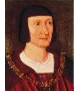
Bayard, le chevalier sans peur et sans reproche (1475, 1524) 1486