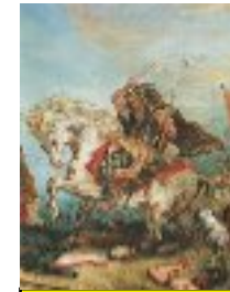
Attila "le fléau de Dieu" (395, 453) 434