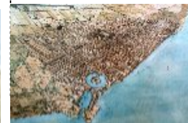
Troisième guerre punique (-149, -146) -149