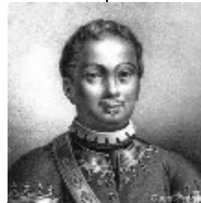
Le chevalier du Guesclin (1320, 1380) 1335