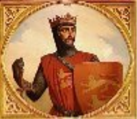
Guillaume le Conquérant (1027, 1087) 1033