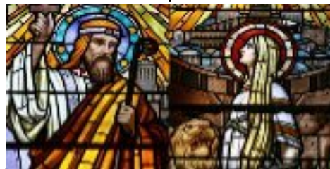
Ste Blandine et St Pothin 177