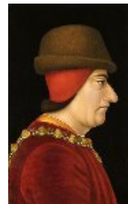
Le Dauphin Louis, futur roi Louis XI (1423, 1483) 1461