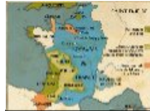
Crécy, Azincourt et Calais 1340