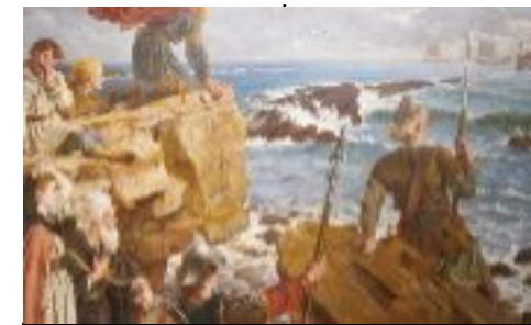
La guerre des Bretons et des Anglo-Saxons 410