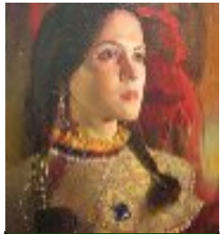
Anne Comnène (1083, 1153) 1091