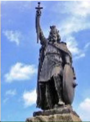
Alfred le Grand et les Danois (846, 899) 871