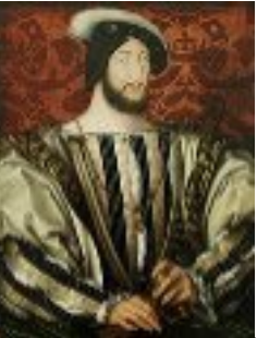
François Ier, un grand roi de France (1494, 1547) 1515