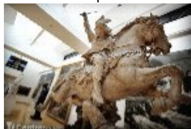
Camille Furianus et les Gaulois (fin -Ve siècle, -363) -403