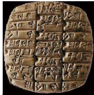
Ecriture cuneiforme 2800 av J.C.