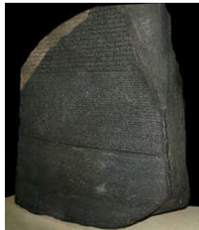
Pierre de Rosette 200 av J.C.