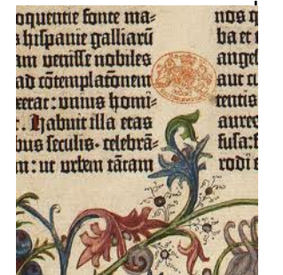
Impression de la Bible en série 1452