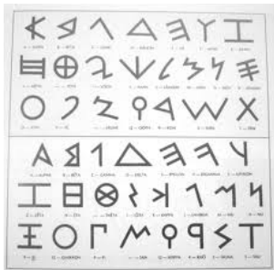
Alphabet phénicien 1300 av J.C.

ABΓDEFIΘIKΛΜΝΞΟΠΡΣΤΥΧΦΨ8 ΑΒΓΔΕΖΗΘΙΚΛΜΝΞΟΠΡΣΤΥΧΦΨ8 8ΥΦΧΥΤΖ49Μ10ΒΥ11J12⊗131415161718